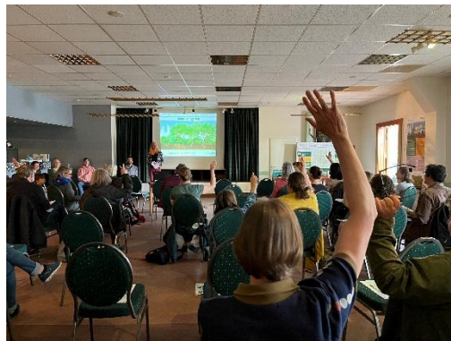
Informationsveranstaltung zum Waldgarten-Kleingartenpark Britz

Im Mai veranstalteten wir zwei umfangreiche Informationstermine für alle Interessierten. Vorgestellt wurden die Vorgeschichte und Förderung des Projekts, das Waldgarten-Prinzip mit Bezug zum konkreten Gärtnern, Rahmenbedingungen zum Mitmachen und die weiteren geplanten Schritte. Die Teilnehmenden konnten sich bei Kaffee und Brezen kennenlernen und alle Fragen loswerden. So konnten wir auch einige neue Waldgärtner*innen für das Projekt gewinnen.