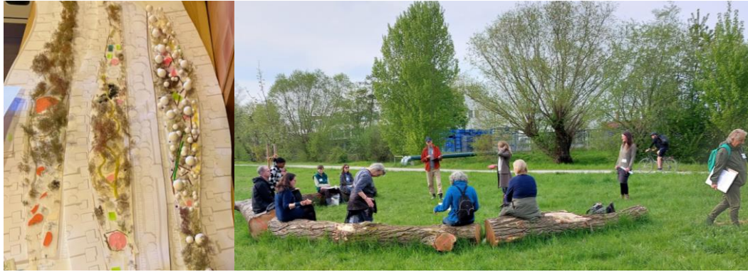
Impressionen aus den Planungsworkshops in Kassel-Waldau

Während am Wahlebach der erste Waldgarten des Projekts angelegt wird, beginnt noch in diesem Winter (2022/23) das Beteiligungsverfahren für den zweiten Urbanen Waldgarten in Kassel.