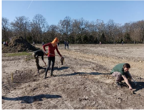
Müllsammelaktion Ende März in Britz