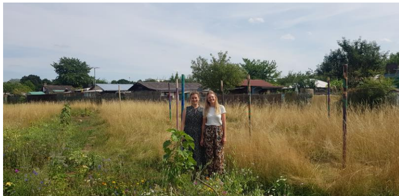
Blühstreifen auf der Waldgartenfläche am Wahlebach

Im Februar wurde der erste Baum, ein „Gravensteiner Apfel“, für den neuen Waldgarten in Kassel-Waldau gepflanzt. Mit dabei waren Vertreter*innen aus Politik, Verwaltung und Presse sowie vom anliegenden Kleingartenverein. Die Baumpflanzung war der Start zur Bürgerbeteiligung in diesem Frühjahr. Die Projektfläche am Wahlebach wird schon jetzt gut genutzt. So pflanzte die Offene Schule Waldau dort beispielsweise verschiedene kleine Gehölze im Zuge eines Erasmusprojektes. Gemeinsam mit der Schule am Lindenberg und der Kita Waldau 2 wurden zwei Blühstreifen angelegt, in denen schon jetzt die Kasseler Blumenwiese herrlich bunt blüht. Die Betreiberstruktur, die aktuell entsteht, gärtnergert bereits in einigen Bereichen auf der Fläche und hat erstes Gemüse für diese Saison angebaut, bevor im Herbst die ersten Mitmachbaustellen beginnen.