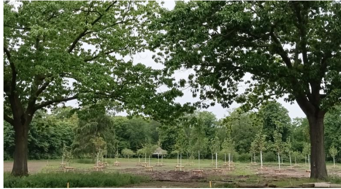
Erstes Grün an den 60 frischgepflanzten Bäumen in Britz