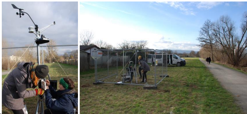
Aufstellung der Klimamessstation am Wahlebachpark Februar 2022

Seit Februar führen wir in Kassel-Waldau am Wahlebach die ersten wissenschaftlichen Messungen durch. Auf dem Streifen östlich der geplanten Waldgartenfläche haben wir unsere Klimamessstation mit allen Sensoren installiert. Seitdem werden kontinuierlich Daten zum Ist-Zustand des städtischen Mikroklimas an dieser Fläche aufgezeichnet und dienen als Vergleich für die Entwicklungen im zukünftigen Waldgarten nebenan.