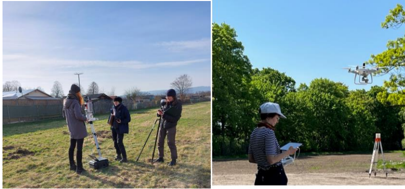
links: Messkampagne in Kassel Wahlebachpark Februar 2022, rechts: Drohnenbefliegung Berlin-Britz Mai 2022