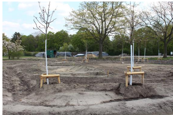
Erste Bäume kurz nach der Pflanzung Ende April (Foto: Lea Matscheroth)

Im April wurden die ersten 60 Bäume im Gemeinschaftsgarten gepflanzt. Es wachsen hier seitdem Kirschen, Pflaumen, Äpfel, Esskastanien, Walnüsse, Ebereschen, Quitten, Mispeln und viele mehr. Der erste Wasseranschluss ist bereits gesetzt und die Gruppe trifft sich nun wöchentlich zum Bewässern der Bäume. Gerade in diesem trockenen Sommer war das unentbehrlich für die bereits recht großen Bäume, damit sie gut am neuen Standort anwachsen können. Einige Bäume trugen sogar schon Früchte!