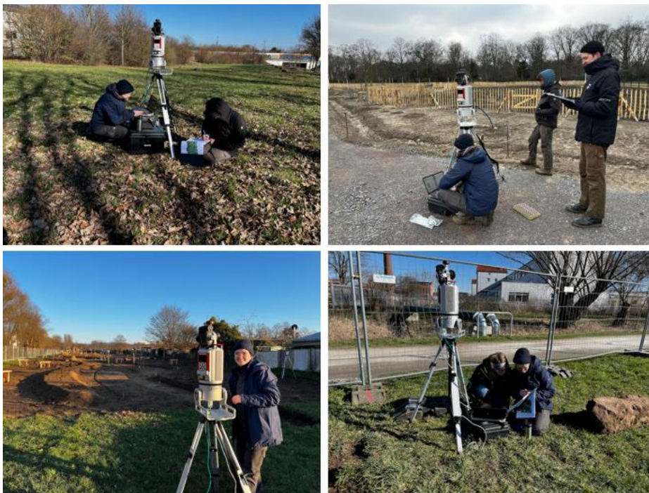
Anfang März: Das Team der Uni Potsdam mit dem Laser-Scanner auf den Flächen der Waldgärten (o.l. Kassel-Helleböhnweg, o.r. Berlin-Britz, unten Kassel-Wahlebachpark

Das Team der Uni Potsdam beobachtet die Veränderungen auf den Flächen und besonders genau die Entwicklung der Pflanzenstruktur. Ein Teil der Erhebungen ist optisch. Dafür werden Aufnahmen aus der Luft geschossen mit einer Drohne. So kann man die Veränderungen über die Jahre und Jahreszeiten gut nachvollziehen.