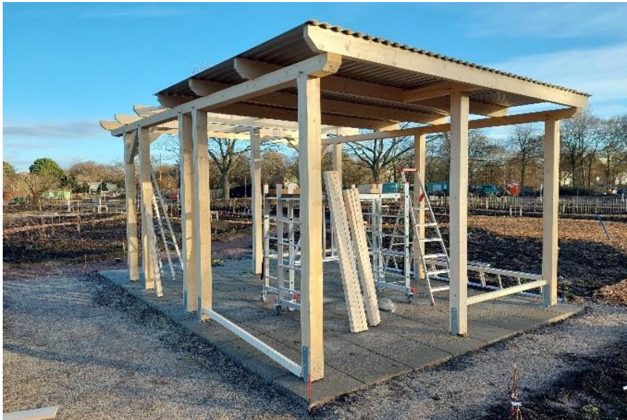
Gerätehaus im Gemeinschaftsgarten Britz

Zur Lagerung von Schaufeln, Harken, Schubkarren usw. steht nun ein 24 qm großes Gerätehaus aus Holz zur Verfügung. Wir freuen uns, bald die Geräte aus den vollgestapelten Übergangslösungs-Containern ausräumen und neu sortieren zu können.