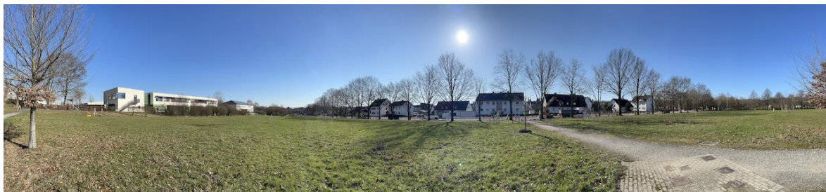
Panorama-Aufnahme am Helleböhnweg März 2023

Im Januar 2023 wurde zum Start der Beteiligung und der Planung des zweiten Waldgartens in Kassel am Helleböhnweg der erste symbolische Baum gepflanzt: ein nordhessischer Wildapfel aus Beberbeck. Aktuell sind alle Bürgerinnen und Bürger eingeladen, sich bei der Planung zu beteiligen und bei der Entwicklung des Waldgartens am Helleböhnweg mitzumachen.