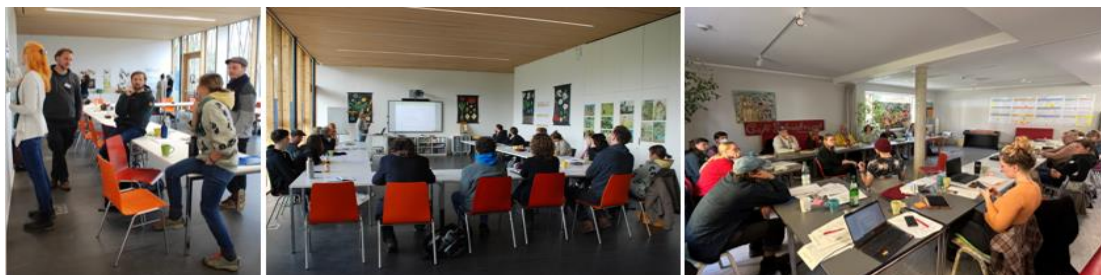
Austausch und Vernetzung für urbane Waldgärten, Aufnahmen von April und Oktober 2022

Wir veranstalten vom 12. bis 15. Oktober eine Veranstaltungsreihe in Berlin, die zu einem spannenden fachlichen Austausch über das Konzept Waldgarten einlädt: zum einen soll das Konzept verschiedenen Facherehaltungen und Planer*innen näher gebracht werden und zum anderen sollen beim 3. bundesweiten Vernetzungsworkshop die Erfahrungen und Herausforderungen in der Umsetzung aus Sicht von Initiativen thematisiert werden. Der Wissensaustausch zu urbanen Waldgärten und die Vernetzung der teilnehmenden Initiativen steht im Fokus. Wir freuen uns über Input und Anregungen zur Ausarbeitung des Programms.