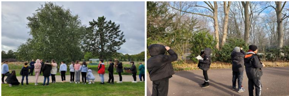
Schulklassen erfahren, entdecken und erforschen Natur im Britzer Garten

Der Winter hatte die Natur fest im Griff, also haben wir uns in dieser Zeit damit beschäftigt, Themen rund um den Waldgarten mit Schüler*innen zum Abschluss zu bringen und für eine Präsentation vorzubereiten. So haben die Schüler*innen der Schule am Bienwaldring sich intensiv mit dem Thema „Bestäuber“ beschäftigt und tolle Plakate erstellt, auf welchen sie ihre Ergebnisse festgehalten haben. Sie haben gelernt, wie Insekten und Blüten aufgebaut sind, und nachgespielt, wie der Pollen von einer Blüte zur anderen gelangt. Im Frühjahr werden die Plakate im Waldgarten in Berlin ausgestellt.