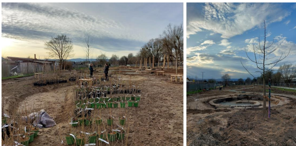
Eindrücke von der Mitmachbaustelle am Wahlebachpark März 2023

Ein großes Danke an alle, die dabei waren und die, die Aktionen zu einem vollen Erfolg gemacht haben!