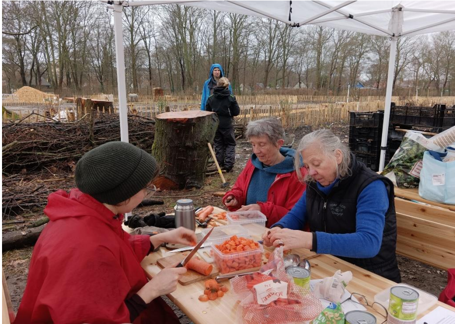
Gemeinsames Kochen auf der Mitmachbaustelle