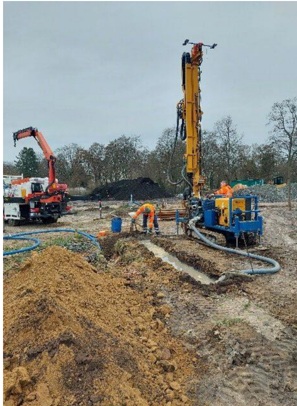
Brunnenbau im Gemeinschaftsgarten Britz

Anfangs hätten wir nicht gedacht, dass der Stromanschluss so lange auf sich warten lässt – nun sind wir umso glücklicher, unsere zwei auf der Fläche platzierten Stromkästen anzapfen zu können. Von Kaffee kochen bis zum Holzbau mit Kreissäge ist nun alles möglich!