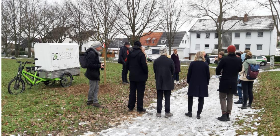
Pressetermin am Helleböhnweg im Januar 2023

Im Januar 2023 wurde zum Start der Beteiligung und der Planung des zweiten Waldgartens in Kassel am Helleböhnweg der erste symbolische Baum gepflanzt: ein nordhessischer Wildapfel aus Beberbeck. Aktuell sind alle Bürgerinnen und Bürger eingeladen, sich bei der Planung zu beteiligen und bei der Entwicklung des Waldgartens am Helleböhnweg mitzumachen.