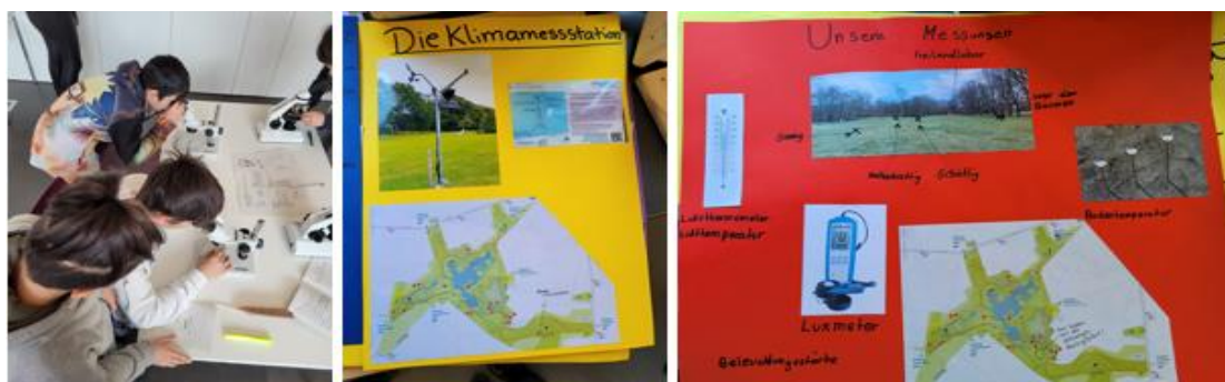
Die Kinder lernen verschiedene wissenschaftliche Methoden und Geräte kennen und präsentieren ihre Arbeit

Die teilnehmenden 5. und 6. Klassen der Walter-Gropius-Schule haben in Präsentationen ihre Erkenntnisse untereinander und mit ihren Eltern geteilt. Ergänzend zu den Tätigkeiten, welche wir mit ihnen auf unserer Ausweichfläche, dem Britzer Garten, durchgeführt haben, recherchierten sie in der Schule und der Bibliothek zum Thema „Zeit“ und kamen dabei zu ganz unterschiedlichen Forschungsfragen. Eine Sonnenuhr warf die Frage auf, wie das eigentlich mit den Römischen Zahlen funktioniert. Wieso teilen wir Zeit so komisch ein, dass es zwölf Monate mit unterschiedlicher Anzahl an Tagen gibt, die wiederum 24 Stunden mit je 60 Minuten haben? Und warum verfärben sich Blätter im Laufe des Jahres bevor sie ganz abfallen? Was machen Tiere im Winter? Ihre Messungen und Erfahrungen, die sie im Britzer Garten gesammelt und anschließend ausgewertet haben flossen dabei in ihre Recherchen ein.