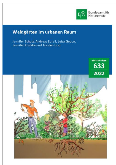
Titelblatt des Berichtes "Waldgärten im urbanen Raum"

Eine Druckversion des 300 Seitigen Berichtes kann ab sofort per email kostenfrei beim Bundesamt für Naturschutz bestellt werden unter: FG-II41@bfn.de