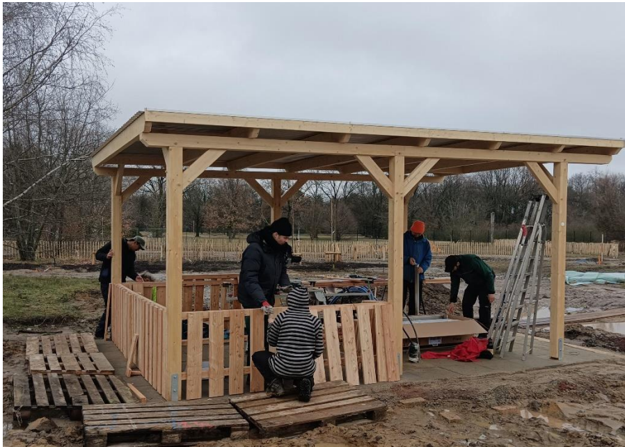
Bau der Außenküche

Mitte März trotzten wir zwei Tage lang dem extrem ungemütlichen Wetter und bauten trotz Schnee, Regen, Wind und Matsch fleißig an der neuen Außenküche. Außerdem legten wir auch viele Meter Totholzhecken an. Neben dem Grundgerüst der Küche ist nun auch der Innenausbau vorbereitet; die Spüle und die ersten Schubladen wurden platziert. Unterstützt wurden wir dabei von den Mitarbeiter*innen der KUBUS gGmbH, einem Träger von sozialen Beschäftigungs- und Bildungsprojekten für Arbeitslose. Die Freude, endlich im Garten aktiv zu werden, war stärker als das Frieren. Beim Sägen, Karre fahren und gemeinsamen Kochen zu Mittag wurde uns etwas wärmer.