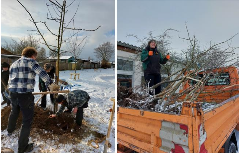
Freiwillige der Essbaren Stadt und das Projektteam Urbane Waldgärten pflanzen neue Bäume auf der Fläche am Wahlebachpark im Januar 2023