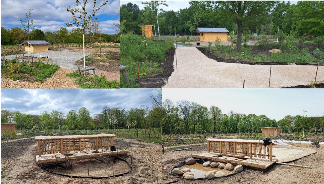
Eindrücke vom Baufortschritt auf der Umweltbildungsfläche, im Wegeausbau und beim Anlegen des zentralen Teichs

Im Bereich der Umweltbildungsfläche ist ein Garten- und Gerätehaus entstanden ebenso wie der Platz davor. Dieser Bereich kann nun für verschiedene Formate der Umweltbildung genutzt und bespielt werden. Es gibt einiges zu entdecken.