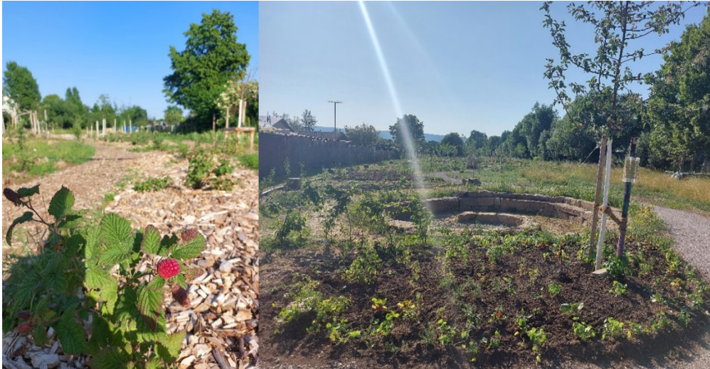
Eindrücke vom Waldgarten am Wahlebach: Die ersten Beeren sind reif und die Pflanzen wachsen an und machen den Ort wieder viel grüner