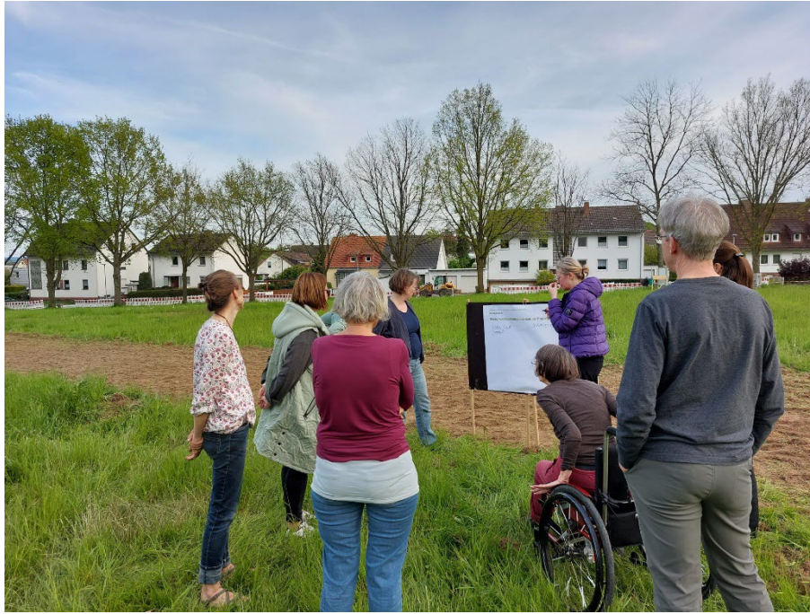
Begehung auf der Fläche am Helleböhnweg mit Überlegungen zur Gestaltung des Waldgartens