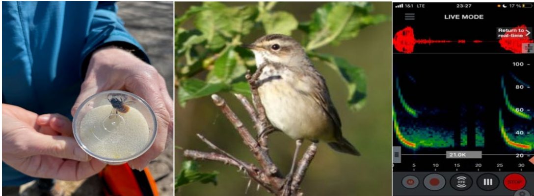
Bestimmung von einer Wildbiene durch einen Gutachter (links, Foto Jennifer Schulz), ein Weidenlaubensänger (mittig) als Beispiel für die Beobachtung und Zählung von Brut- und Singvögeln auf den Flächen (Foto: Mia Lührs). Ein akustisches Aufnahmebild von Fledermäusen (Abbildung: Mia Lührs)

Obstbäume und Stauden im Waldgarten etablieren und können somit immer mehr als Nahrungsquelle durch Wildbienenbestände dienen.