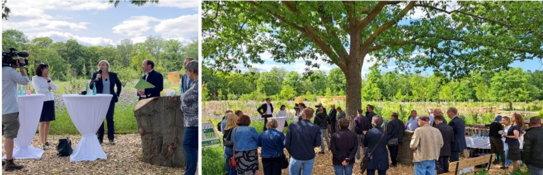
Die Eröffnung des Waldgartens mit Presse und öffentlichen Persönlichkeiten, die zur Umsetzung mit beigetragen haben.