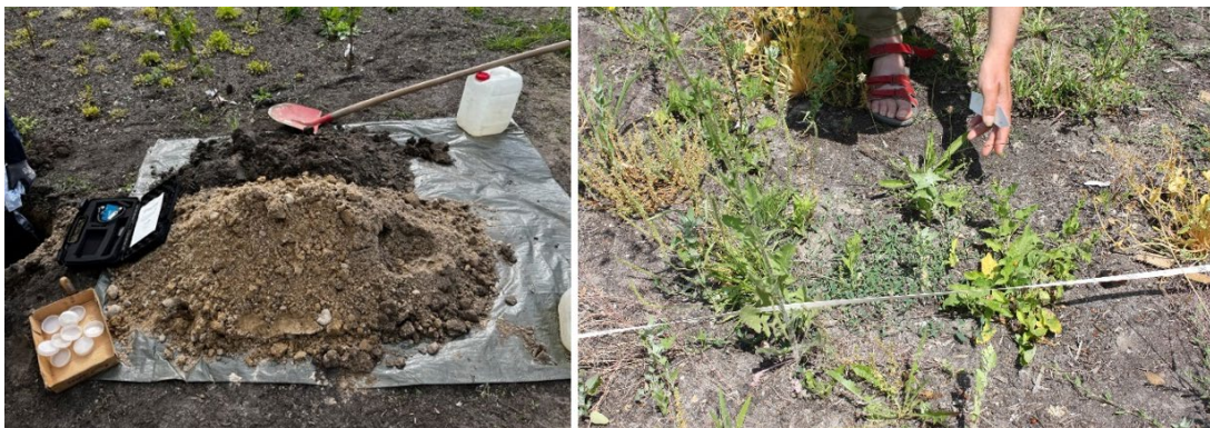
Bodenbeprobung (links) und Bestimmung der sich zusätzlich ansiedelnden Vegetation (rechts)

Gleichzeitig wurden die Waldgartenflächen nach der Fertigstellung der Bauarbeiten und der Bepflanzung, bodenkundlich untersucht. Der Boden wurde dabei aus unterschiedlich angelegten Zonen der Waldgärten ausgehoben, beschrieben und beprobt. Die entnommenen Proben werden auf physikalische und chemische Eigenschaften im Labor geprüft. Mit dem wachsenden Waldgarten oberirdisch, werden auch unterirdisch Veränderungen im Boden ablaufen, was zum Beispiel durch eine stärkere Durchwurzelung aufgrund der Pflanzenanzahl und durch den Eintrag von organischem Material aus gärtnerischen Aktivitäten zusammenhängt. Mit der Zeit kann sich dies auf den Bodenaufbau und die Bodenfruchtbarkeit auswirken.