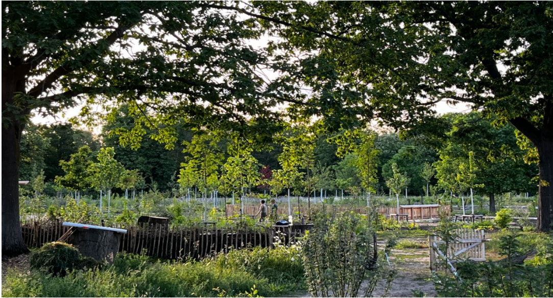
Beim offenen Gärtner am Mittwochnachmittag sind alle herzlich willkommen

Zahlreiche Wildkräuter haben schon ganz von allein ihren Weg in den Waldgarten gefunden, die meisten sind als Bodenschutz willkommen und blühen zum Teil schon wunderschön. Lediglich die sehr dominanten, problematischen Kräuter, die die gepflanzten Stauden verdrängen können, werden von der Gruppe gejätet und in Mulch oder Kompost verwandelt.