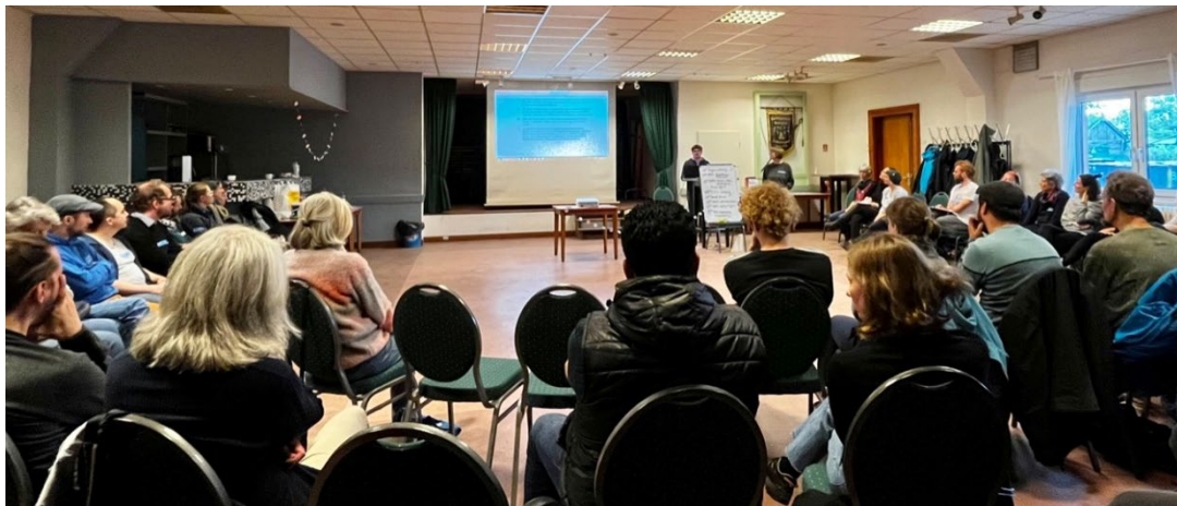
Versammlung zur Vereinsgründung

Die Vereinsgründung ist vollbracht! Am Samstag, den 07.05.23 hat die inzwischen bestens organisierte Gruppe rund um den Waldgarten Britz den Waldgarten Berlin-Britz e.V. gemeinsam gegründet und eine erste ordentlichen Mitgliederversammlung abgehalten.