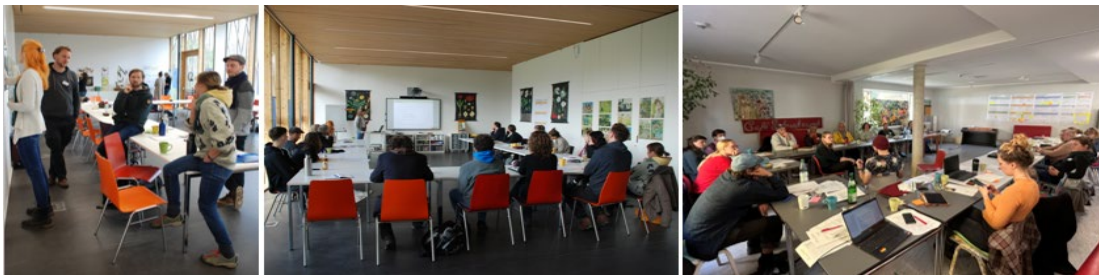
Austausch und Vernetzung für urbane Waldgärten, Aufnahmen von April und Oktober 2022

Dieses Jahr freuen wir uns ganz besonders, dass wir nicht nur unseren 3. bundesweiten Vernetzungsworkshop zum ersten Mal in einem unserer angelegten Waldgartenflächen durchführen können, sondern auch dass wir diesen über drei Tage als Workshop-Wochenende im Oktober (13.10. bis 15.10.23) planen. Über die Tage hinweg soll ein üppiges Programm stattfinden mit praktischen und theoretischen Themen, welche durch Vertreter*innen der Initiativen und uns zusammengestellt werden. Außerdem steht natürlich der Austausch und das Kennenlernen untereinander weiterhin im Fokus. Bei den letzten beiden Vernetzungsworkshops nahmen 12 bzw. weitere städtische Waldgarten-Initiativen teil, die entweder bereits einen Waldgarten betreiben oder aber am Anfang der Entwicklung stehen und durch den Austausch mit anderen Initiativen dringende Fragen klären und Unterstützung finden können. Falls Ihr selber gerade einen urbanen Waldgarten entwickelt und oder Eure Erfahrungen teilen wollt, meldet Euch gerne unter koordination@urbane-waldgaerten.de .