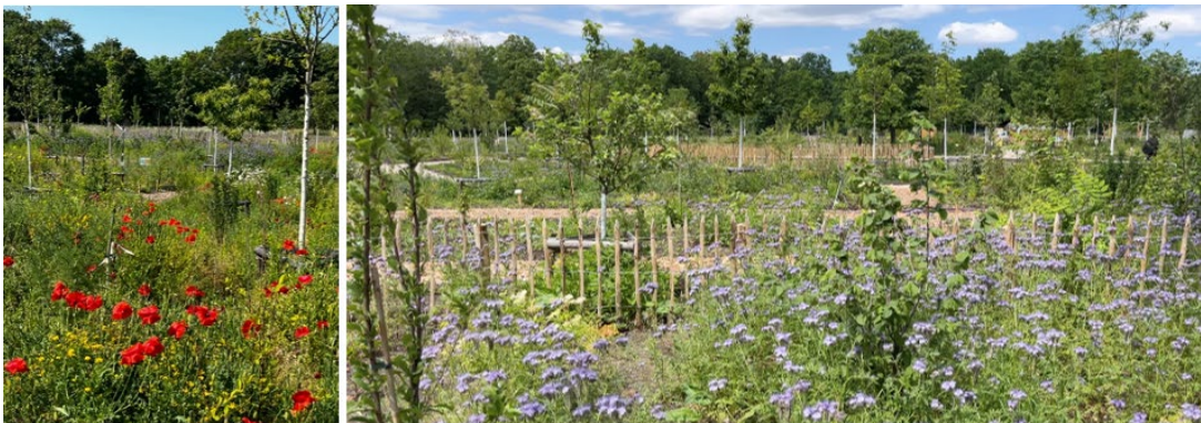
Eindrücke vom Blütenmeer im Waldgarten Berlin-Britz

Zahlreiche Wildkräuter haben schon ganz von allein ihren Weg in den Waldgarten gefunden, die meisten sind als Bodenschutz willkommen und blühen zum Teil schon wunderschön. Lediglich die sehr dominanten, problematischen Kräuter, die die gepflanzten Stauden verdrängen können, werden von der Gruppe gejätet und in Mulch oder Kompost verwandelt.