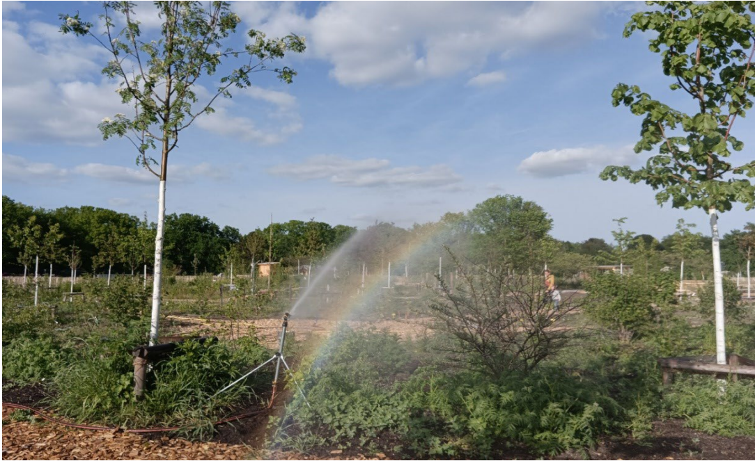
Bewässerung im Waldgarten Berlin-Britz an den heißen trockenen Tagen

Sehr stolz und glücklich sind wir über unsere neuen Pflanzen-Schilder! 120 Gehölz- und 90 Staudenarten wurden von Christian Opperer wunderschön illustriert, die wichtigsten Infos wie Wuchshöhe, Licht-/Wasserbedarf, essbare Pflanzenteile und Erntezeiten sind auf einen Blick zu sehen. Ein QR-Code wird die Pflanzenschilder auf der Projektwebseite sichtbar machen und soll im Laufe der Zeit mit umfassenderen Steckbriefen der jeweiligen Pflanze ergänzt werden.