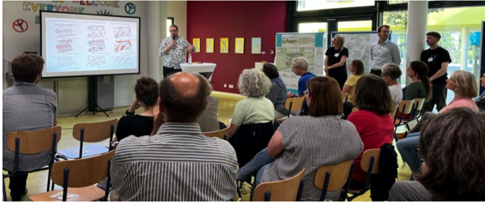
Entwurfspräsentation zur Gestaltung des Waldgarten am Helleböhnweg mit interaktivem Austausch mit Interessierten

Wer sich in das Projekt in Kassel miteinbringen möchte, kann sich gerne an Britta oder Antonia unter kassel@urbane-waldgaerten.de wenden.