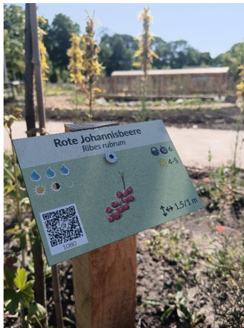
Pflanzenschild im Waldgarten Berlin-Britz mit Zeichnungen von Christian Opperer

Sehr stolz und glücklich sind wir über unsere neuen Pflanzen-Schilder! 120 Gehölz- und 90 Staudenarten wurden von Christian Opperer wunderschön illustriert, die wichtigsten Infos wie Wuchshöhe, Licht-/Wasserbedarf, essbare Pflanzenteile und Erntezeiten sind auf einen Blick zu sehen. Ein QR-Code wird die Pflanzenschilder auf der Projektwebseite sichtbar machen und soll im Laufe der Zeit mit umfassenderen Steckbriefen der jeweiligen Pflanze ergänzt werden.