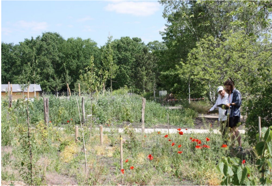
Vegetationskartierung im Lichtungsbereich des Waldgartens Berlin Britz durch Gutachterinnen