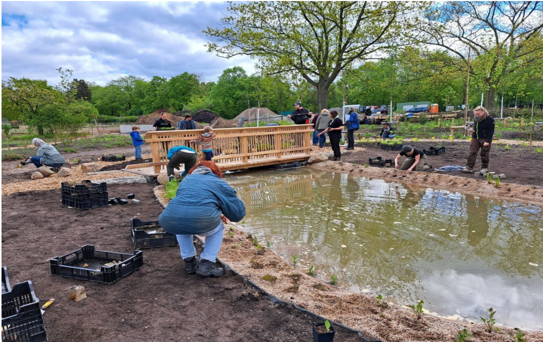
Teichbepflanzung mit der Gemeinschaft

schwirren einige Libellen dort herum und konnten auch schon bei der Eiablage im Teich beobachtet werden. Auch ein Entenpärchen kam ein paarmal zu Besuch.