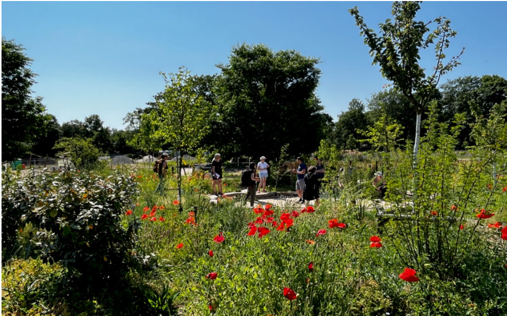
Führung von Ruben Rosendahl zu essbaren Pflanzen im Waldgarten am 11.06.23

auf regelmäßige Führungen und auch gern aktiv mitmachende Gäste im Waldgarten-Kleingartenpark.