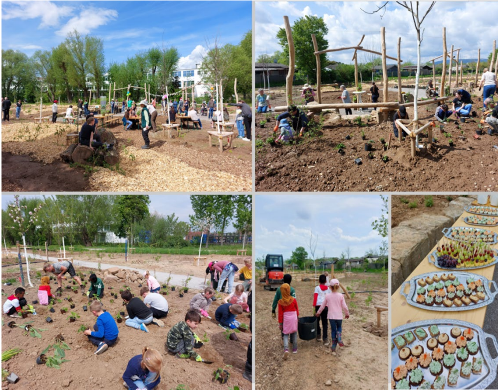
Freiwillige der Essbaren Stadt und das Projektteam Urbane Waldgärten pflanzen neue Bäume auf der Fläche am Wahlebachpark im Januar 2023