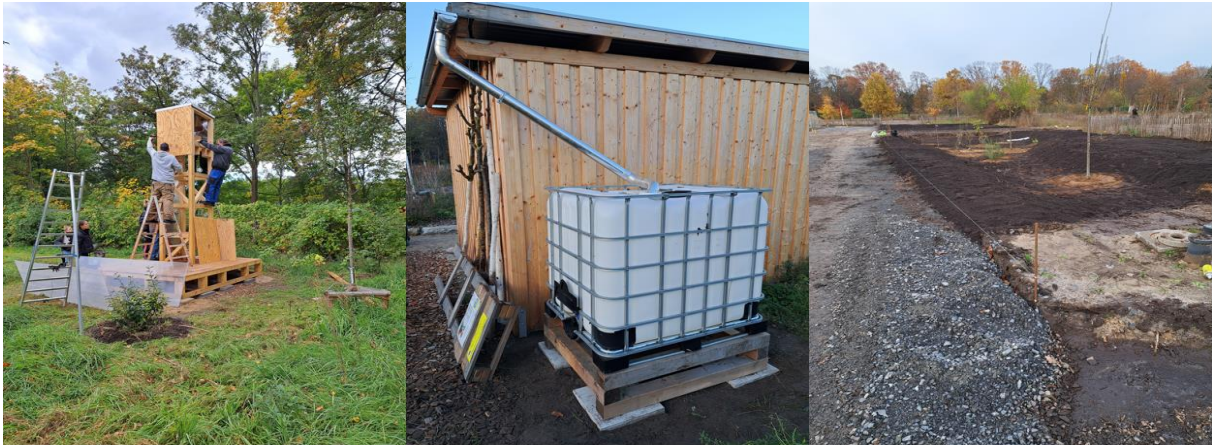
Aufstellung des Vogelturms, Regenwasserspeicher und Bereitung des Rahmengrüns

gepflanzt worden, so dass nun die Pflanzungen abgeschlossen sind und wir uns gemeinsam auf die Pflege und Ernte konzentrieren werden.