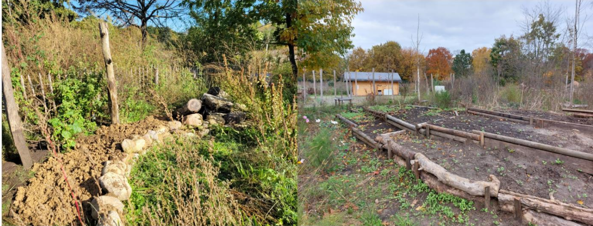
Die Gestaltung der Umweltbildungsfläche Berlin-Britz