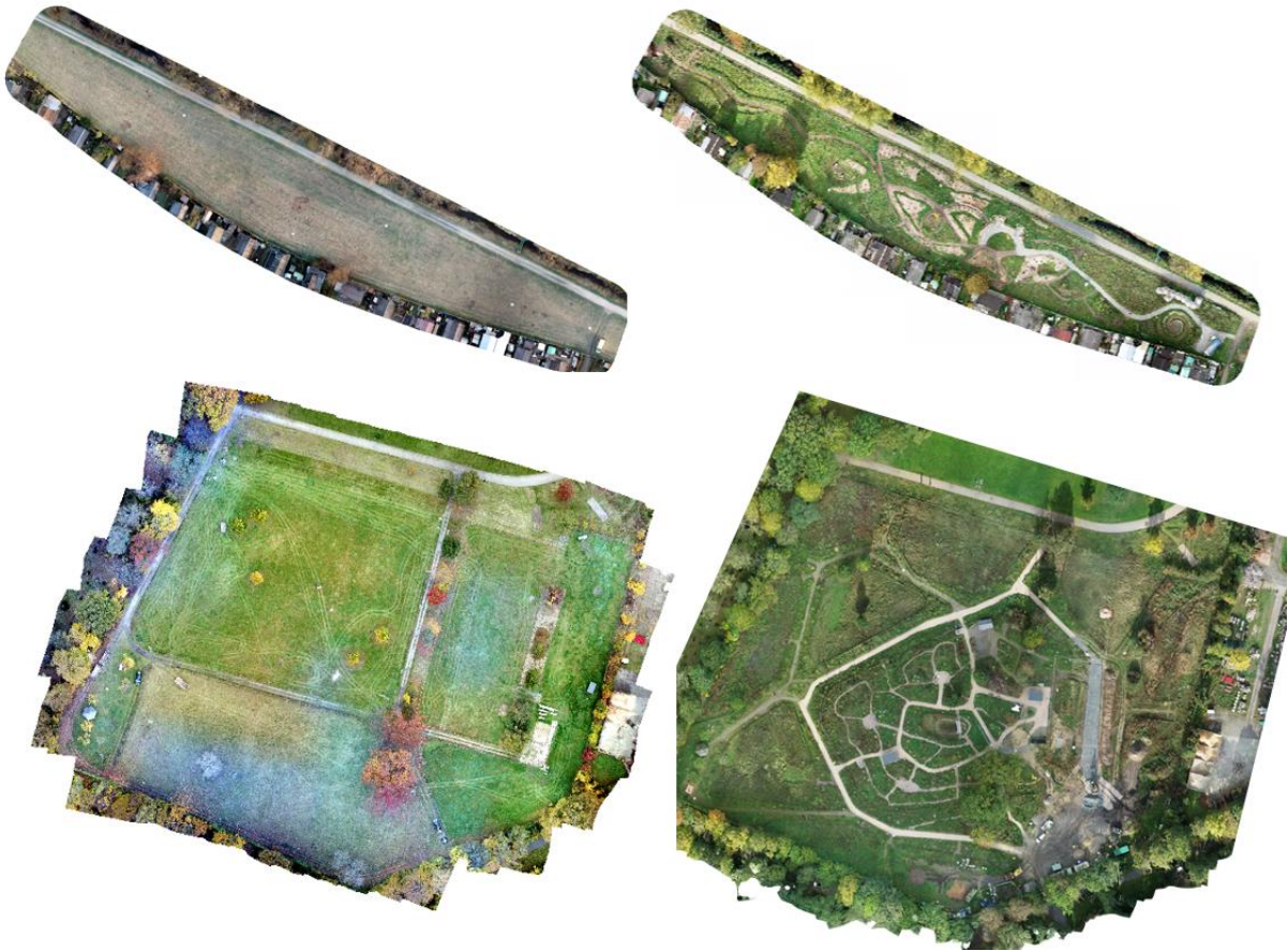
Ansicht: Drohnenbefliegung der entstandenen Waldgärten am Wahlebach, Kassel Gegenüberstellung von Januar 2022 und Oktober 2023; und in Berlin-Britz Oktober 2021 und Oktober 2023. (Foto und Erstellung: Lea Matscheroth)

Eine tolle Übersicht wie sich die Flächen der bisher entstandenen Waldgärten bis heute schon verändert haben!