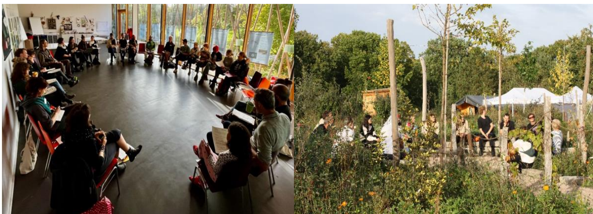
Eindrücke vom Vernetzungsworkshop 2023 drinnen und draußen

In den letzten Wochen gab es ebenfalls im Bereich der Vernetzung ein volles 3-tägiges Programm. Mitte Oktober haben wir bereits zum dritten Mal zur bundesweiten Vernetzung urbaner Waldgarten Initiativen eingeladen. Dieses Mal konnte der Vernetzungswshops zum ersten Mal auch im neu angelegten Waldgarten in Berlin-Britz stattfinden, welches uns natürlich besonders gefreut hat und zu gemeinsamen Tagen positiv beigetragen hat. Von einem gemütlichen ersten Zusammenkommen mit Leckereien aus den unterschiedlichen Gärten am Freitagnachmittag bis zu einem Ausklang während des Herbstfestes des Gartenvereins am Sonntagmittag konnten wir viele tolle Menschen aus den Initiativen deutschlandweit begrüßen und über den Zeitraum die Möglichkeit zum Kennenzulernen und Vernetzen durch gemeinsame Aktivitäten, wie diverse Themenworkshops und Gruppendiskussionen bieten. Wir blicken immer noch freudig auf das Wochenende zurück und bedanken uns sehr bei allen 31 Teilnehmenden aus 22 Garteninitiativen für das tolle Miteinander und den schönen gemeinschaftlichen Austausch! Für nächstes Jahr planen wir auch schon ein weiteres Vernetzungstreffen, welches auf den Themen, Diskussionen und Feedback aufbauend Mitte Oktober 2024 in Kassel stattfinden soll, wozu wir alle Interessierten schon jetzt herzlich einladen.