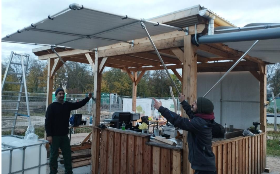
Die Außenküche und ihre neuen Klappen