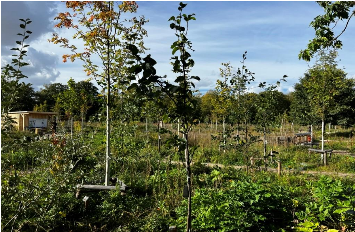
Urbaner Waldgarten Berlin Britz im Oktober 2023