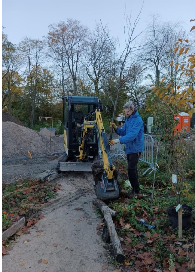
Pflanzaktion mit Minibagger

Am 17. und 18.11.23 wurde ein ganzer Schwung Gehölze im Gemeinschaftsgarten und Rahmengrün nachgepflanzt. Darunter waren einige große Bäume, z.B. Süßquitte, Maulbeere und Rosinenbaum, die mit Pflanzpfählen und Baumbindungen versehen werden mussten. Zum Glück gab es bei den ganz großen Kandidaten Hilfe vom Minibagger. Neben klassischen Himbeeren und Johannisbeeren fanden auch winterharte Granatäpfel und Avocados ein neues zu Hause im Gemeinschaftsgarten. Wir sind gespannt was daraus wird!