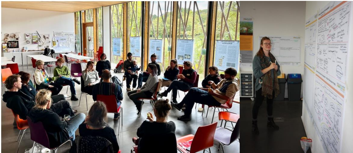
Fish-Bowl Methode beim Vernetzungsworkshop 2023

Grünflächenämter sowie Planer*innen gerichtet und wir waren erfreut über die rege Teilnahme aus ganz Deutschland. Mittels vielseitiger Vorträge durch Teammitglieder, involvierte Fachverwaltungen und Planner*innen aus den Projekten in Berlin und Kassel konnten wir einen praxisnahen Einblick in die Projektentwicklung und -planung sowie zu Pflanzenauswahl und Pflegeperspektiven für urbane Waldgärten geben. Abschließend gab es außerdem einen Ausblick auf Fördermöglichkeiten für Waldgärten als städtische Naturoasen im Aktionsprogramm Natürlicher Klimaschutz durch einen Mitarbeiter der KfW. Gerne unterstützen wir interessierte Städte und Kommunen inhaltlich bei der Entwicklung eigener städtischer Waldgärten mit den Erfahrungen aus dem Projekt Urbane Waldgärten und planen weiter Webinare für Fachverwaltungen im nächsten Jahr.