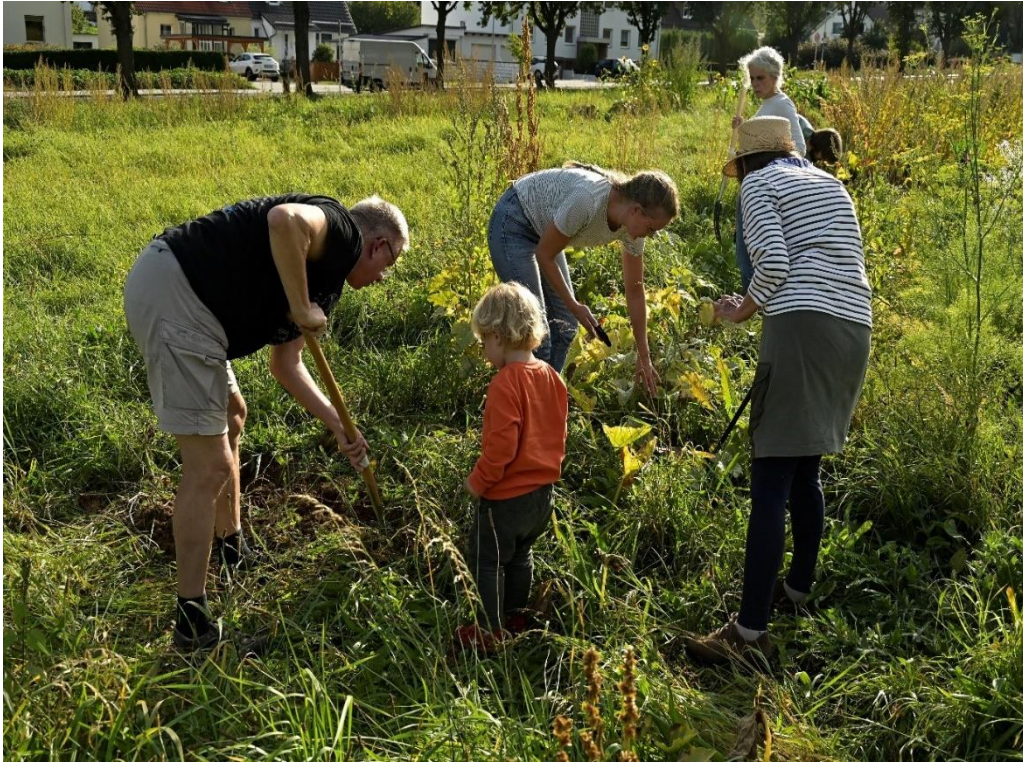
Ernten auf dem vorübergehenden Beetstreifen

zurückziehen dürfen. Der Baustellenstart verzögert sich wetterbedingt aktuell ein wenig, aber die Gehölze sind bereits gekauft und warten auf ihren Einsatz. Diesen Winter sollen sie noch gepflanzt werden, sodass einem Saisonstart im Mai kommenden Jahres nichts im Wege stehen sollte.