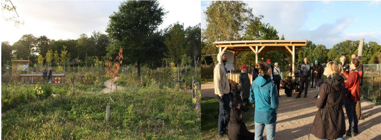
Vernetzungsworkshop im Waldgarten Berlin-Britz Oktober 2023