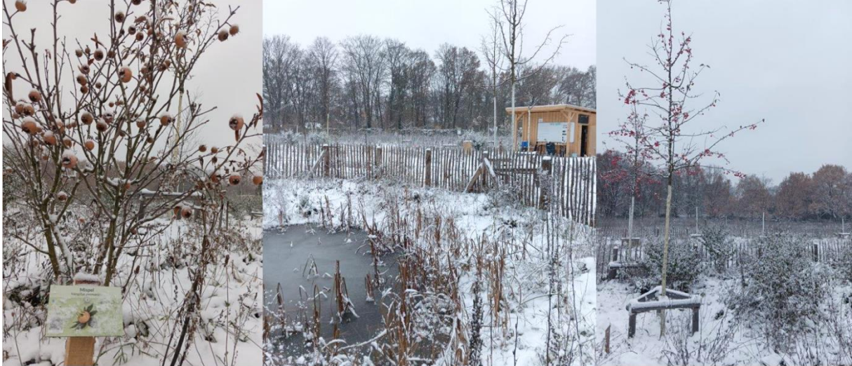
Wintereindrücke aus Berlin-Britz