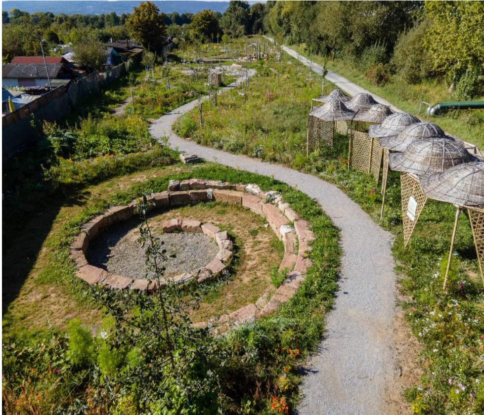
Aufnahme von oben am Wahlebach