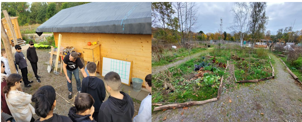
Umweltbildungsaktivitäten und Beete im Waldgarten Berlin-Britz