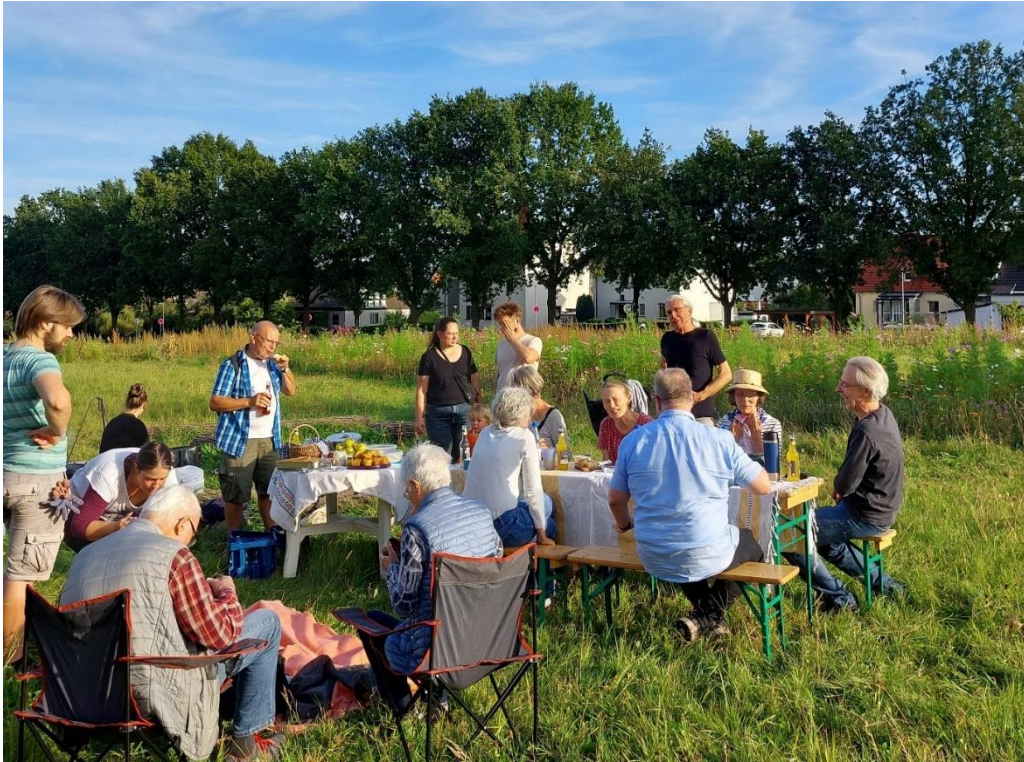
Erntedankfest auf der Fläche am Helleböhnweg Kassel